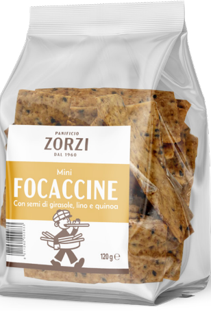
Con Girasole, Quinoa e Lino

Peso netto: 120 g GTIN-13: 8011262 00283 3 Pezzi per Cartone: 8 N° Cartoni per EPAL: 60 Dim. pallet: 80x120x120 cm