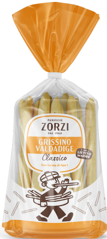
Classico tipo "1"

Peso netto: 250 g GTIN-13: 8011262 00062 4 Pezzi per Cartone: 10 N° Cartoni per EPAL: 36 Dim. pallet: 80x120x120 cm