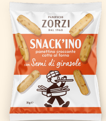
Con semi di girasole

Peso netto: 210 g GTIN-13: 8011262 00279 6 Pezzi per Cartone: 6 N° Cartoni per EPAL: 36 Dim. pallet: 80x120x120 cm