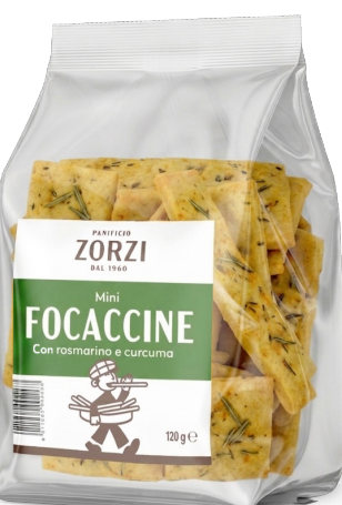
Con Rosmarino e curcuma

Peso netto: 120 g GTIN-13: 8011262 00282 6 Pezzi per Cartone: 8 N° Cartoni per EPAL: 60 Dim. pallet: 80x120x120 cm