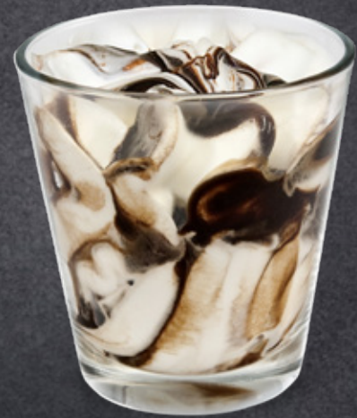
Fiordilatte variegato al Cioccolato Fiordilatte swirled throughout with Chocolate sauce