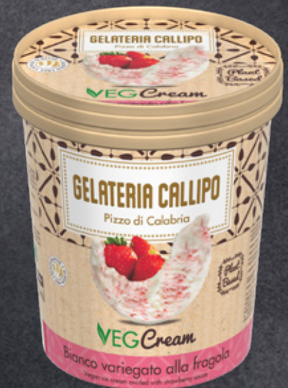
Bianco variegato alla Fragola White Vegan flavour swirled with strawberry sauce