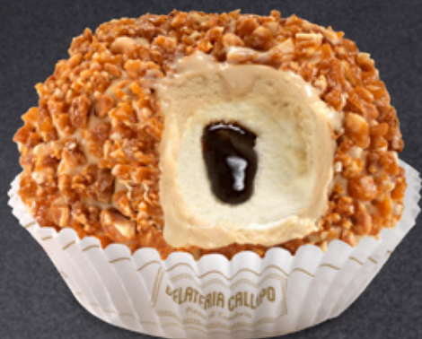
Caffè e Panna Coffee and Cream

con esclusivo cuore liquido with our exclusive fluid heart