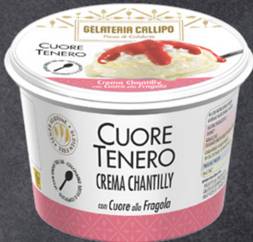
Crema Chantilly con Cuore alla Fragola Chantilly cream with Strawberry filling