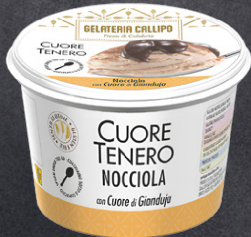
Nocciola con Cuore di Gianduja Hazelnut with Gianduja filling