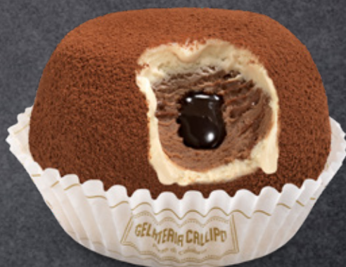
Nocciola e Cioccolato Hazelnut and Chocolate