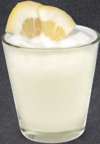
Sorbetto al Limone di Sicilia Lemon from Sicily Sorbet