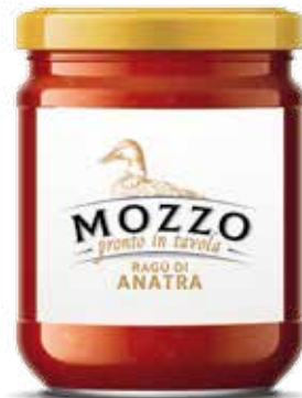
— ANATRA — DUCK RAGOUT