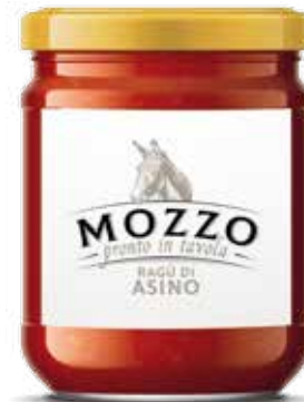
— ASINO — DONKEY RAGOUT