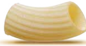
— TORTIGLIONI — PM002035