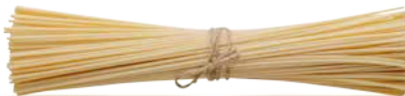
— SPAGHETTI — PM002040