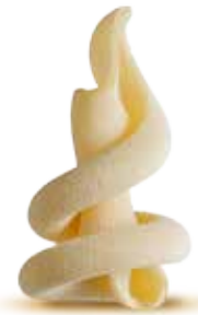
— TROTTOLE — PM002036