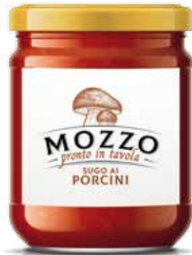
— PORCINI — PORCINI MUSHROOMS SAUCE