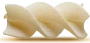
— FUSILLONI — PM002034