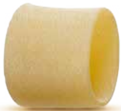
— PACCHERI — PM002037