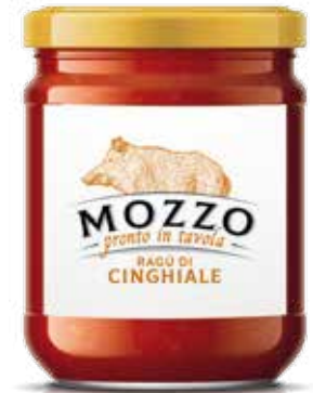
— CINGHIALE — WILD-BOAR RAGOUT