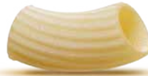
— TORTIGLIONI — PM005109