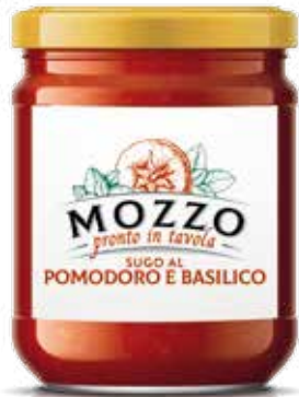
— POMODORO E BASILICO — TOMATO AND BASIL SAUCE