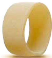
— CALAMARATA — PM002038