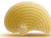
— LUMACHE — PM002030