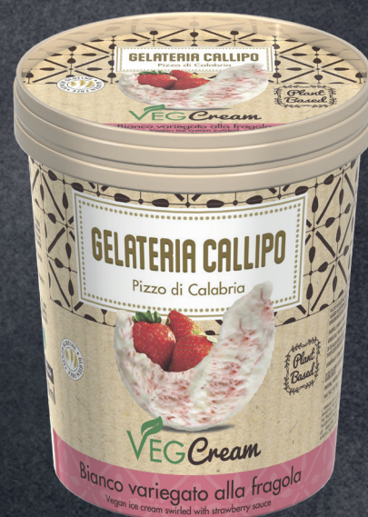
Bianco variegato alla Fragola White Vegan flavour swirled with strawberry sauce