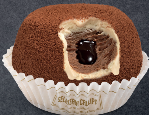
Nocciola e Cioccolato Hazelnut and Chocolate