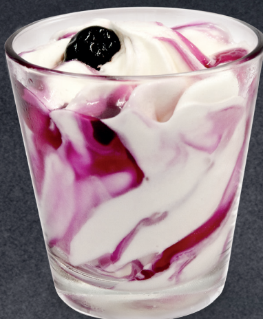
Fiordilatte variegato all' Amarena Fiordilatte swirled throughout with sour Black Cherry sauce