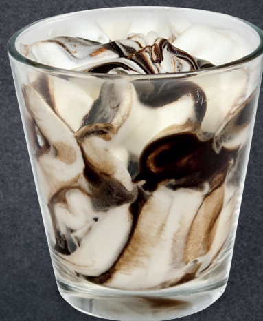
Fiordilatte variegato al Cioccolato Fiordilatte swirled throughout with Chocolate sauce