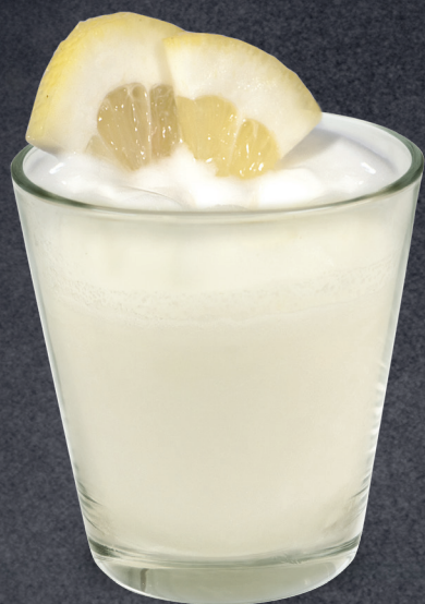
Sorbetto al limone di Sicilia Lemon from Sicily Sorbet