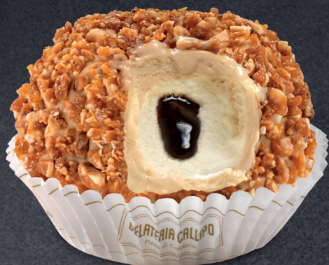
Caffè e Panna Coffee and Cream

con esclusivo cuore liquido with our exclusive fluid heart