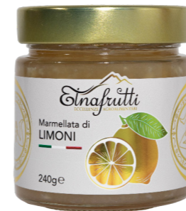
Limoni / Lemons barattolo in vetro 240gr glass jar with 240gr

Prodotte con frutta fresca e zucchero, senza additivi. Ideali per la colazione o per farcire dolci, offrono un gusto naturale e autentico