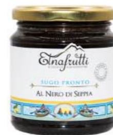
Nero di seppia / Cuttlefish ink barattolo in vetro 280gr glass jar with 280gr

Artigianali e preparati con ingredienti freschi e di alta qualità. Perfetti per condire pasta, e riso, esaltano il sapore autentico della cucina siciliana