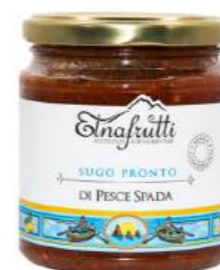
Pesce spada / Swordfish barattolo in vetro 280gr glass jar with 280gr