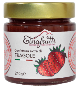
Fragole / Strawberries barattolo in vetro 240gr glass jar with 240gr

Artigianali ricche di frutta e sapore. Perfette per spalmare su pane o per arricchire dolci, offrono un'esperienza gustativa unica