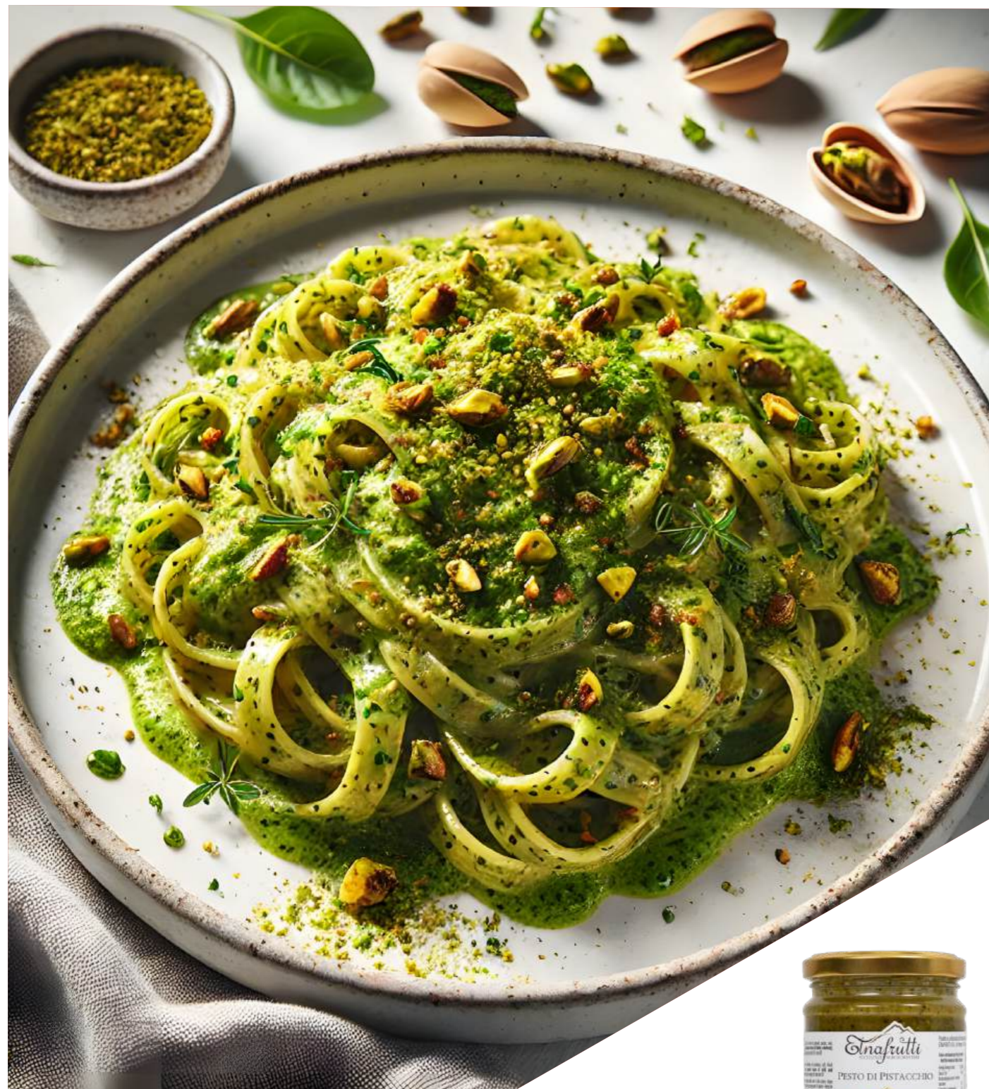
Pistacchi / Pistachio barattolo in vetro 190gr glass jar with 190gr

Realizzati con ingredienti selezionati, offrono un sapore unico. Ideali per condire pasta, crostini o per arricchire piatti con un tocco di gusto siciliano