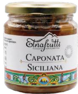
Caponata Siciliana / Sicilian Caponata barattolo in vetro da 280gr glass jar with 280gr

Preparati con verdure fresche e saporite. Perfetti per accompagnare piatti di carne o pesce, aggiungono un tocco di autenticità alla tua tavola.