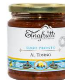
Tonno / Tuna fish barattolo in vetro 280gr glass jar with 280gr