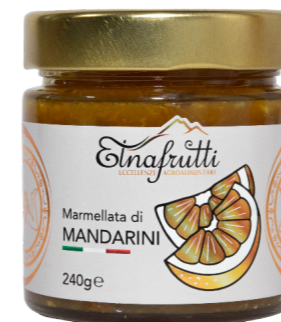
Mandarini / Mandarins barattolo in vetro 240gr glass jar with 240gr