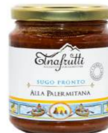
Palermitana / Palermitan barattolo in vetro 280gr glass jar with 280gr