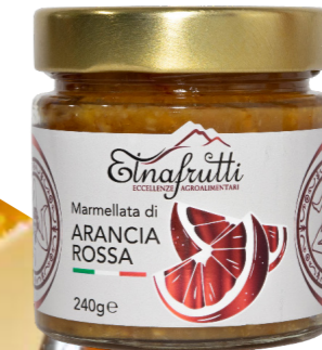
Arancia Rossa / Red orange barattolo in vetro 240gr glass jar with 240gr