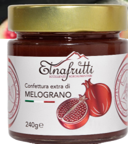
Melograno / Pomegranate barattolo in vetro 240gr glass jar with 240gr