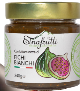
Fichi bianchi / White Figs barattolo in vetro 240gr glass jar with 240gr