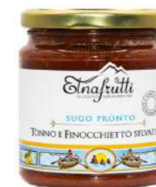
Tonno e finocchietto / Tuna fish and Wild Fennel barattolo in vetro 280gr glass jar with 280gr