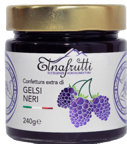
Gelsi neri / Black mulberries barattolo in vetro 240gr glass jar with 240gr