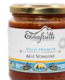
Vongole / Clams barattolo in vetro 280gr glass jar with 280gr