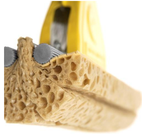
Pulizia Pavimenti Floor Cleaning