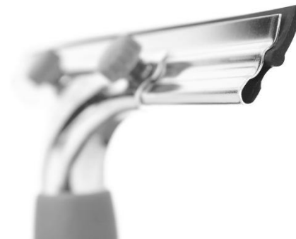
Pulizia Vetri Windows Cleaning