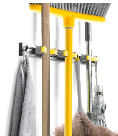
Organizzazione Casa Home Organization