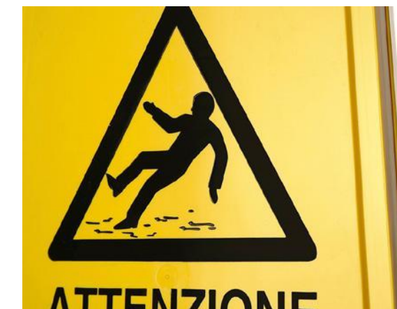
Pulizia Professionale Professional Cleaning