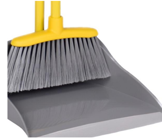
Palette e Alzaimmondizia Dustpans